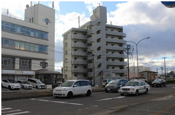
■ 図面と現況が相違する場合は現況優先とさせていただきます。

701号室 現況：賃貸中 面積：20.44㎡（壁芯） 月額賃料等：43,000円